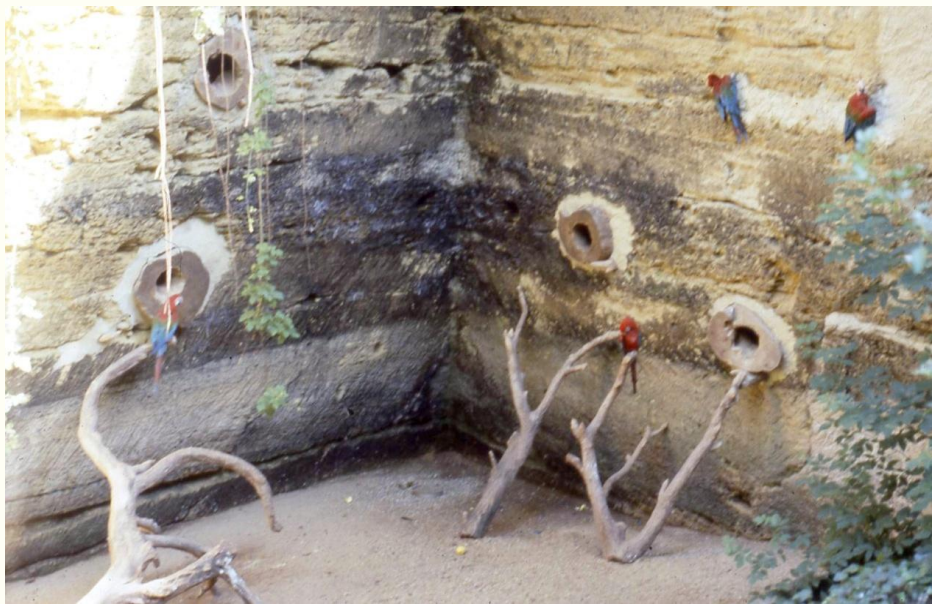
Zoo de Doué la Fontaine 1988