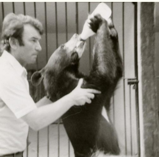
Zoo de la Palmyre 1972

Au long de ces itinéraires, vous découvrirez non seulement de nombreuses photos souvenirs de mes visites, mais également des brochures et papiers publicitaires émis par les zoos eux-mêmes.