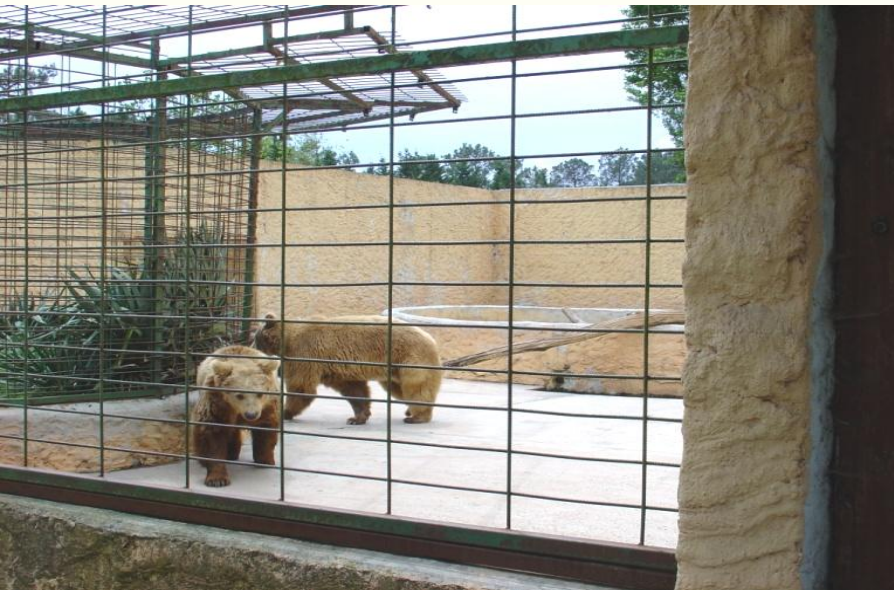
Zoo de Pessac 1997

Ces documents présentés ici témoignent d'une époque où les notions d'hygiène et de bien-être animal étaient encore balbutiantes. Certains de ces zoos ont depuis fermé leurs portes. Les autres ont su évoluer vers des présentations plus adaptées au confort des animaux.